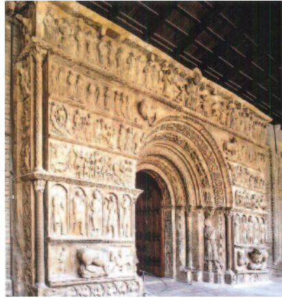
Vista lateral de la Portalada de Ripoll

Tot i que aquests dos aspectes constitueixen l'essència del valor del monument per al nostre país, hem de demostrar a la Unesco que la Portalada és excepcional i universal. Excepcional vol dir ser el millor exemple d'entre tots els que existeixen dintre de la seva categoria i universal significa que ha d'interessar no només a la gent més propera i vinculada amb el bé, sinó tota la humanitat.