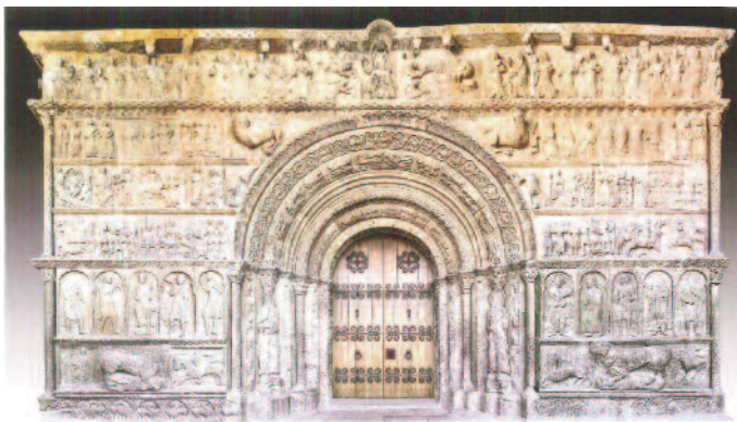
Visió general de la Portalada de Ripoll