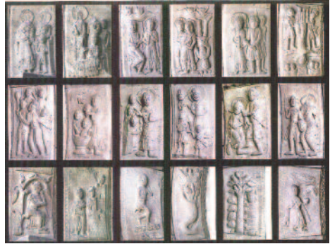
Diferents escenes de la Portalada romànica de Ripoll

Tenim la Portalada dins una gran vitrina condicionada, cosa que ens permet afirmar que actualment la Portalada del monestir de Ripoll és l'únic monument català, i gairebé espanyol, que disposa d'un control absolut de les condicions ambientals en què es preserva i que gaudeix d'uns estudis i anàlisis tan aprofundits que permeten fer un seguiment acurat de la seva evolució. Per tant, també garantim a la Unesco que la Portalada, avui, es conserva en un estat d'integritat òptim per il·lustrar-ne de forma convenient i acurada els valors i el sentit d'existència.