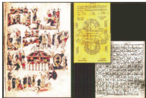
La producció del monestir de Ripoll Bíblies i ciència

A Ripoll trobem un monestir que funciona com a panteó comtal, i aquí és on cal buscar l'excepcionalitat de la Portalada. El que ens proposa la Portalada és un recital d'escenes, que, com he dit, surten de les bíblies miniades que es produïen a