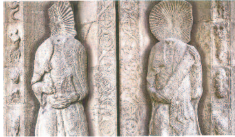
Les estàtues de les columnes de Sant Pere i Sant Pau

També la fa excepcional el fet que aquesta Portalada, que és un cos clarament autònom de la façana, està configurada com un magistral arc de triomf amb un programa iconogràfic excepcional. En la llista del patrimoni mundial de la Unesco hi ha un exemple magnífic d'arc de triomf, a Orange, erigit a l'època de l'emperador August i que explica en els baix relleus l'establiment de la Pax Romana. Sol, aïllat, magnífic, encara avui desprèn l'esperit de la grandesa d'uns emperadors que conquerien territoris i deixaven unes empremtes sòlides i duradores.