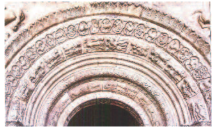
Detall de les arquivoltes de la Portalada