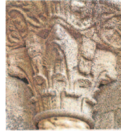
Capitell de la Portalada romànica de Ripoll

Però la Portalada, com el cor de Ripoll que és, batega, està viva. El valor universal excepcional de la Portalada de Ripoll també el trobem, encara avui, en la capacitat que té aquest monument únic d'irradiar interès i atracció. La Portalada és avui encara, ja entrats al segle XXI, un monument viu, que suscita interès i polèmica i que provoca molts debats oberts sobre molts aspectes de les recerques que s'hi fan i de la historiografia del monument, uns debats enriquidors per part dels científics, dels historiadors, dels conservadors. La Portalada irradia avui interès i atrau visitants interessats en la història, en la religió, en l'art, com abans ho van fer el monestir i el seu Scriptorium.