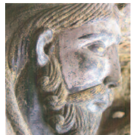
Pantocràtor de Ripoll

Aquesta font d'inspiració és excepcional en la Portalada de Ripoll i constitueix un exemple únic, en referència a altres portalades romàniques europees, amb programes iconogràfics menys complexos, de les quals no es té una relació directa entre el model i la transposició a la pedra.